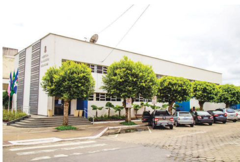
O contribuinte pode parcelar o tributo em até 6 vezes com a primeira parcela vencendo dia sete de junho