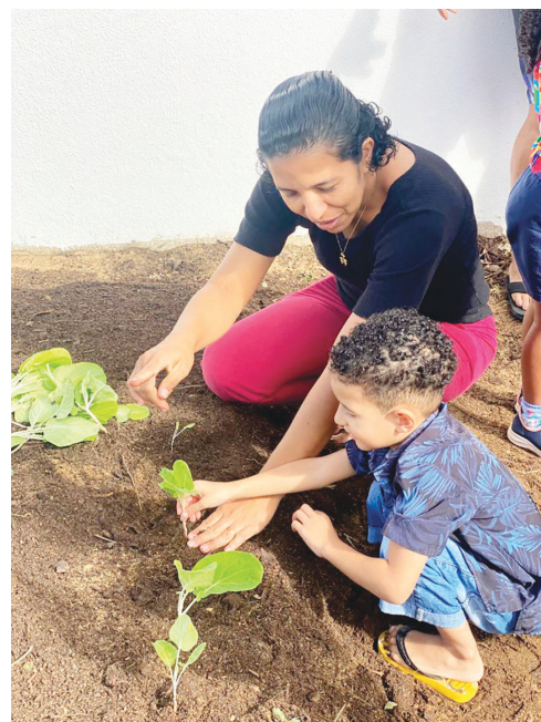
Escola de Bebedouro Ceim Joelma Rocha Vieira adere ao Escola Verde com o mascote ‘Verdinho’

Para abrilhantar a ação que faz parte do “Projeto Escola Verde”, a gestão escolar confeccionou um mascote batizado pelas crianças pelo nome de “Verdinho”. De forma lúdica, o mascote vem para reforçar a todos sobre a im-