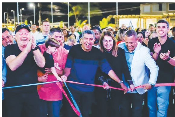
A obra foi inaugurada no último sábado dia 3 de junho pelo prefeito da Serra Sergio Vidigal (PDT)

Ela também lembrou a infância de seus três filhos. “Eles brincaram muito aqui, era o lazer deles. Naquela época tinha uma gangorra e um balanço que parecia uma aranha, disputado por todas as crianças. Lembrar do passado e contemplar como está hoje é uma felicidade. Ver algo destruído e depois presenciar a renovação, é como se fos-